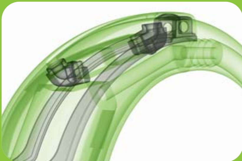
PIÈCES DE FORME EN CAOUTCHOUC DE KUBO FORM DANS UNE PROTHÈSE AUDITIVE