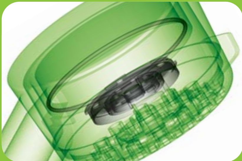
JOINTS DE KUBO TECH DANS UN POMMEAU DE DOUCHE